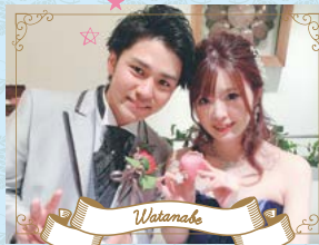
Watanabe 車検の速太郎 春日井店 渡邊